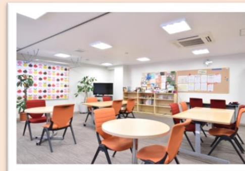
←活動室の様子です。

興味のある方は、パンフレットをご覧ください↓ & 診察時に担当医へご相談ください！